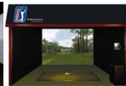
Golf PGA Classic