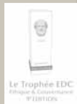
Trophée EDC - Éthique & Gouvernance Les lauréats de la 9 ème édition