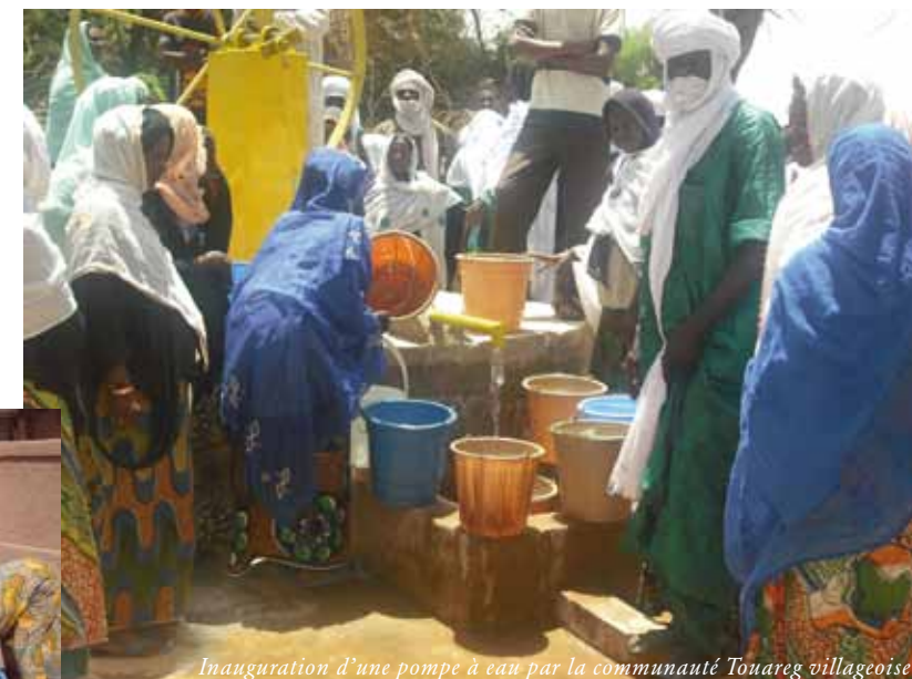
Inauguration d'une pompe à eau par la communauté Touareg villageoise.