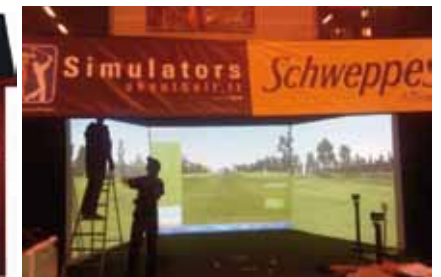
Installation du corner en partenariat avec Schweppes pendant le salon du golf, même partenariat prévu pour l'open de France et le Vivendi Trophy.

tions et notre sérieux dans le suivi commercial et technique de nos clients et partenaires.