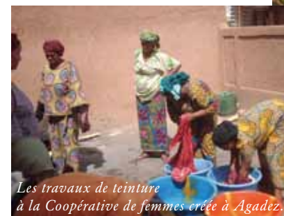
Les travaux de teinture à la Coopérative de femmes créée à Agadez.

Continuer d'appuyer des « projets de dynamique de vie » aux populations d'un des pays les plus pauvres du monde, confrontées à une situation d'isolement particulièrement dramatique depuis quelques mois (l'économie touristique est au point mort après les derniers enlèvements politico-mafieux venus d'ailleurs) et bâtir un modèle « d'apports-partenaires », avec des entreprises aptes à distiller de l'humain dans l'économie, voilà ce que propose Philippe Bastien aux entrepreneurs intéressés.