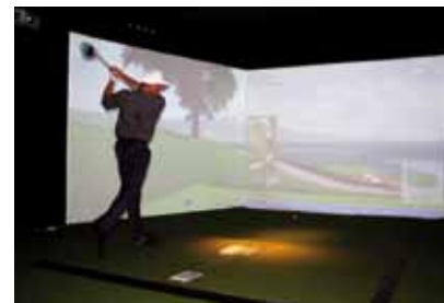
Golf PGA SiM Surround

9ST a atteint un niveau d'expertise lui permettant d'adapter les solutions de simulation existantes aux besoins de ses clients et a le soucis permanent d'apporter à tous ses partenaires commerciaux le meilleur service et le meilleur suivi dans toute l'Europe. Nous avons construit notre réputation grâce à la qualité de nos installa-